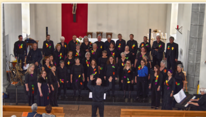
La Chanson des 4 Saisons.