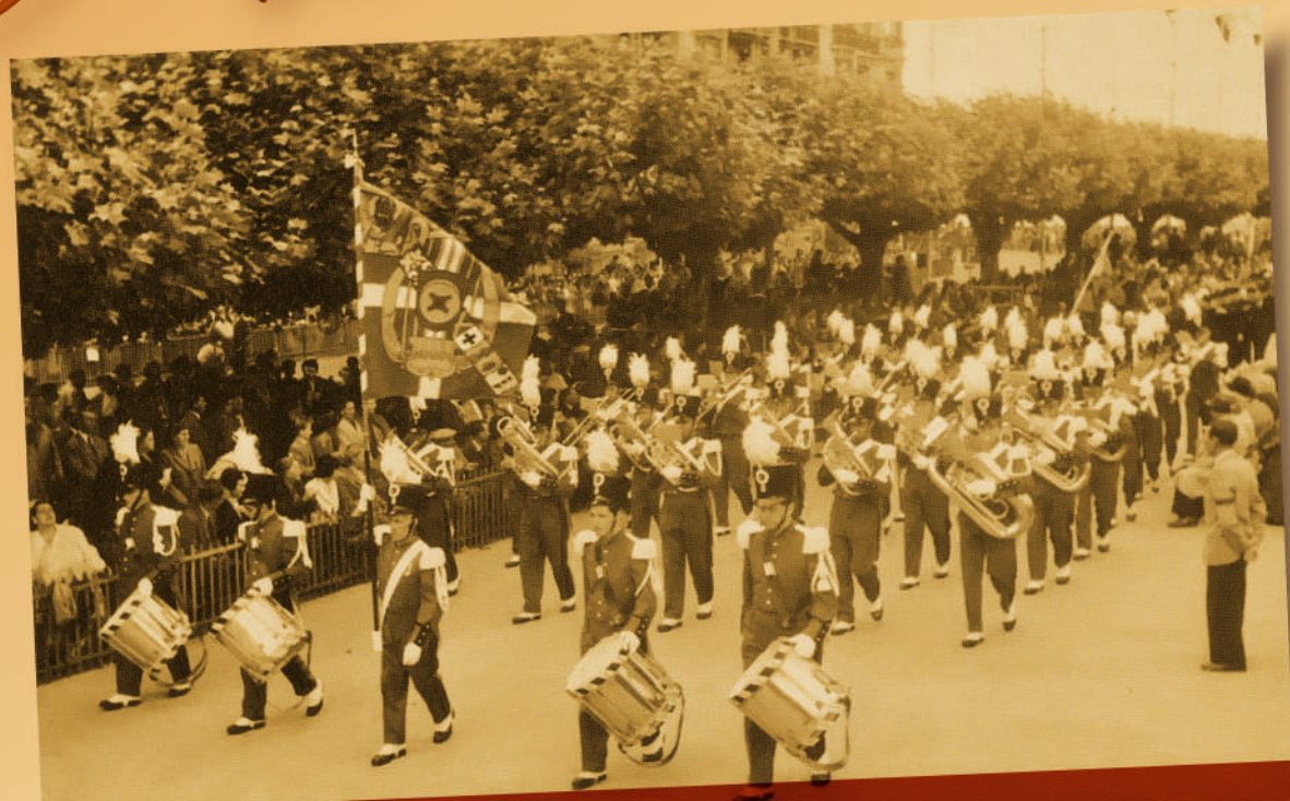
1957 – La Lyre aux Fêtes de Genève.