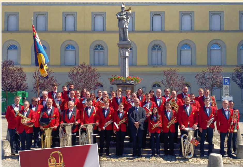
La Lyre devant la fontaine d'Adrian von Bubenbergh.