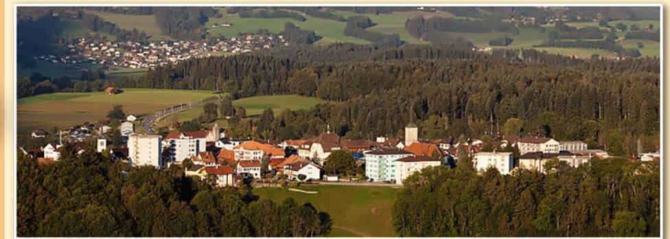
Un concours de très haute qualité dans la charmante localité de Broc.

Les 24, 25 et 26 janvier derniers, le 31 e concours cantonal fribourgeois des solistes s'est tenu sous un magnifique soleil à Broc. Plus de 300 musiciennes et musiciens s'y sont réunis pour concourir et émerveiller un public venu en nombre les soutenir.