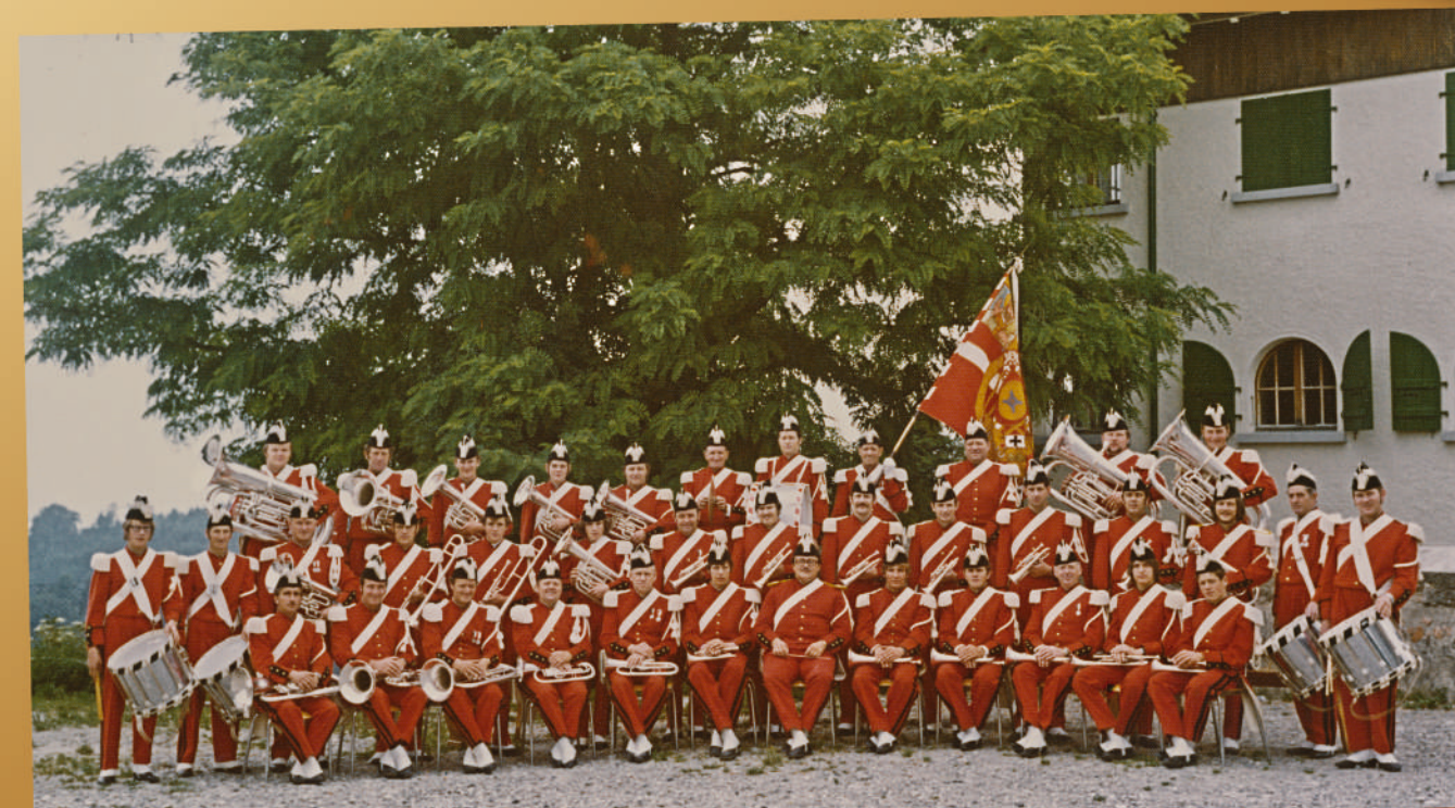
1971 – La Lyre fête son cinquantième anniversaire.