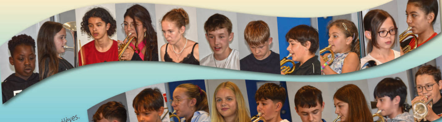
L'audition des élèves.