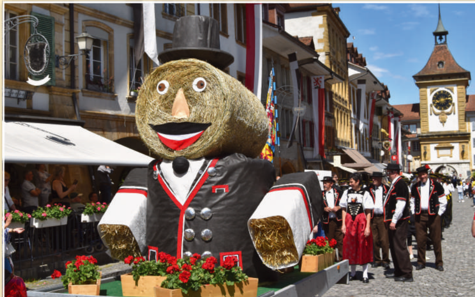
Avec un certain humour.