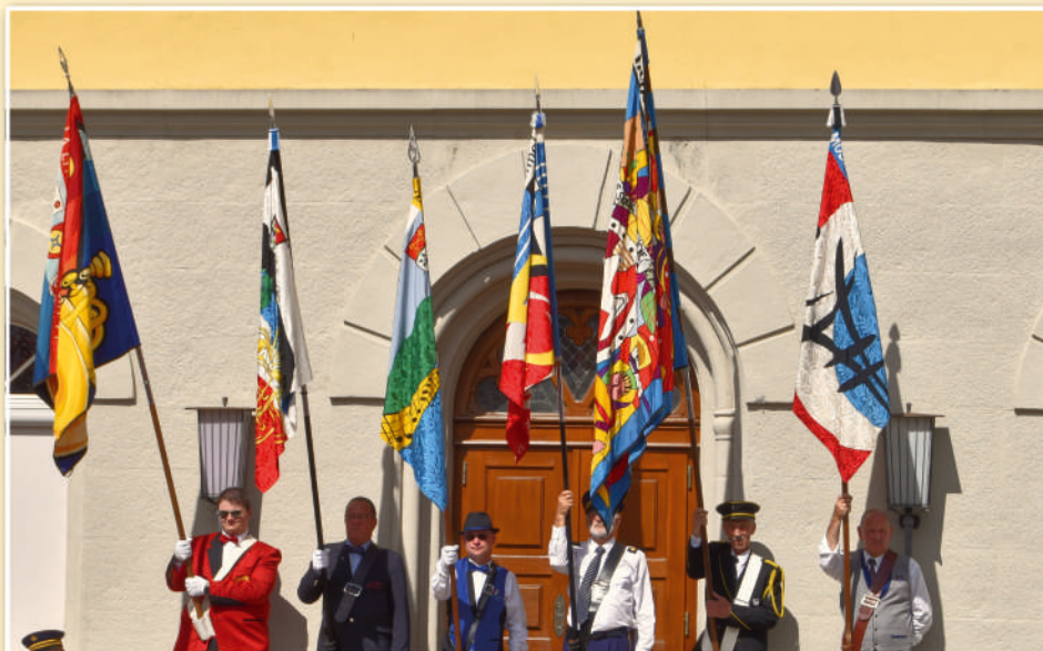
Les drapeaux des sociétés du Giron réunis lors du morceau d'ensemble.

interprétation a su captiver aussi bien le public que les experts. Une fois cette performance derrière nous, place à la détente et à l'exploration! Tandis que certains profitaient des ruelles pittoresques de Morat pour flâner ou se désaltérer, un groupe de musiciens s'est aventuré dans une activité insolite: le tir à l'arbalète. Que ce soit par talent naturel, chance ou simple détermination, quelques-uns d'entre eux se sont révélés être de véritables tireurs d'élite. Leurs tirs ont été si remarquables qu'ils ont même décroché un prix, remis en grande pompe le soir même sous la cantine. Un exploit inattendu qui a suscité des éclats de rire et des applaudissements chaleureux de la part de tous les musiciens présents.