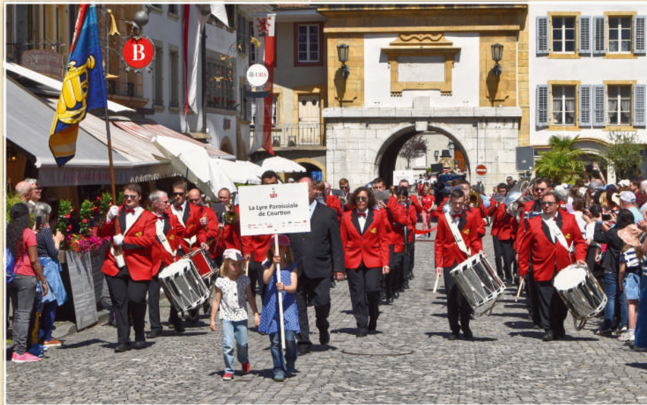
Un cortège dans un décor chargé d'histoire.