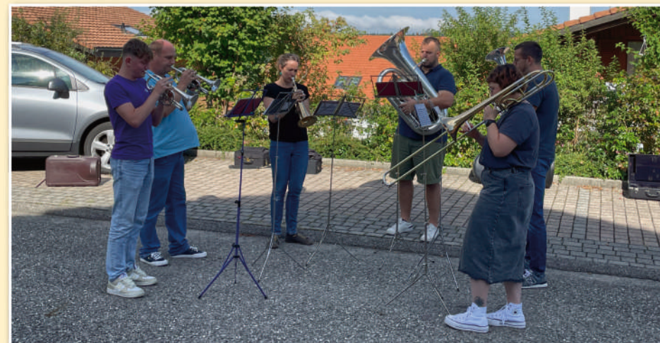
Un petit groupe de la Lyre.

Les 6 et 7 septembre 2024, la Lyre a remis à l'honneur une tradition autrefois bien ancrée dans notre commune et notre société: la tournée de la Bénichon. Alliant musique et convivialité, cet événement a offert aux habitants l'occasion de découvrir ou redécouvrir le répertoire festif de notre brass band, tout en célébrant dignement cette fête traditionnelle.