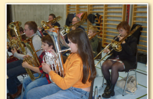
Une découverte de la musique dans une ambiance chaleureuse.