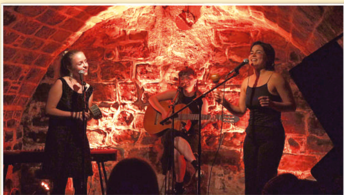
JAJABI &amp; BARAKA.