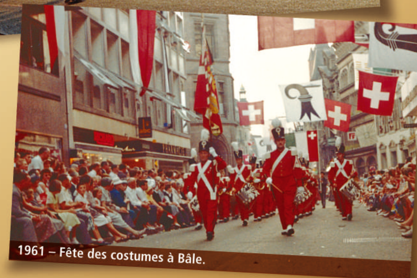
1961 – Fête des costumes à Bâle.