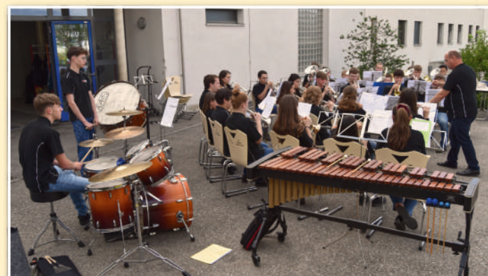
Le Young Harmonic Band.