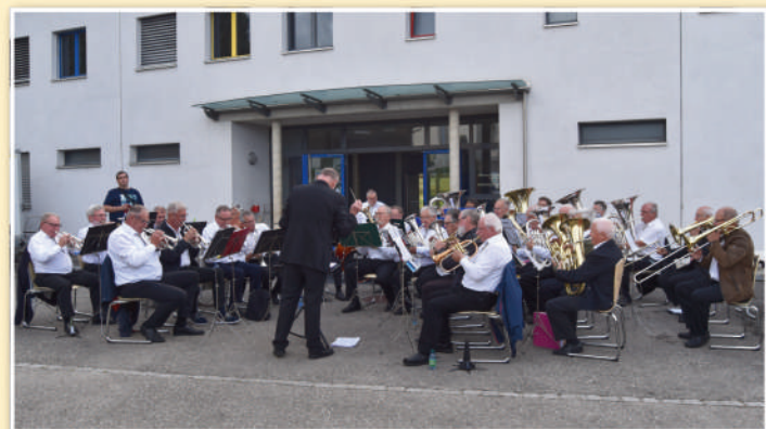
L'Ensemble de Cuivres Broyards.