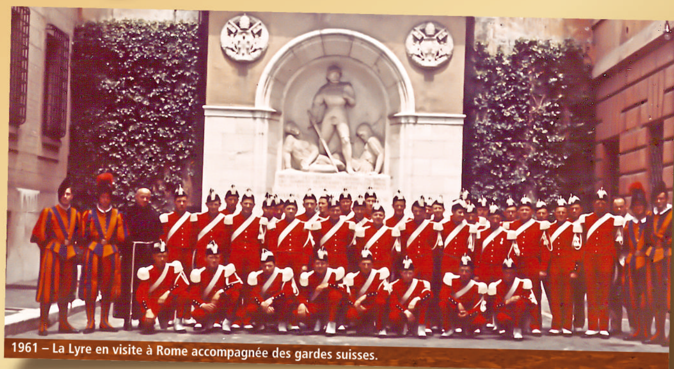
1961 – La Lyre en visite à Rome accompagnée des gardes suisses.