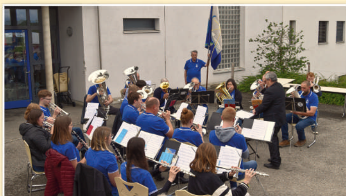
La Lyre de Belfaux.